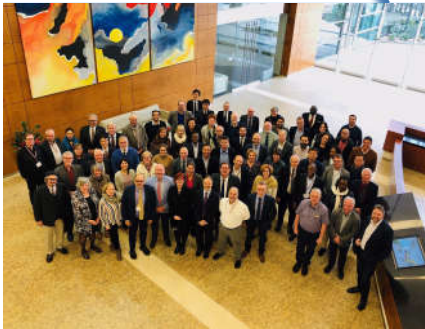
Dallas 2019

P - Members: 77 beteiligte Normungsorganisationen